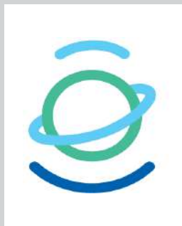
Muitinės praktikų asociacija