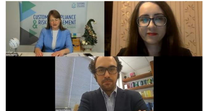
3rd Authors' meeting